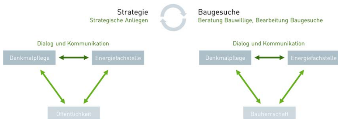
Figure 1 Betrachtungsrahmen des Leitfadens: Fokus ist der Dialog zwischen dem Amt für Denkmalpflege und dem Amt für Energie, sowohl in strategischen Belangen als auch auf Ebene einzelner Baugesuche (dunkelgrüne Pfeile). Der Dialog mit der breiten Öffentlichkeit bzw. den Bauherrschaften (hellgrüne Pfeile) wird nur am Rande thematisiert. Die Austausche auf Ebene Strategie und Baugesuche können sich gegenseitig ermöglichen bzw. intensivieren (graue Pfeile).

In diesem Leitfaden wird der Dialog zwischen dem Amt für Denkmalpflege und dem Amt für Energie betreffend die Sanierung denkmalgeschützter Gebäude beleuchtet. Beide Ämter bzw. Fachstellen haben einen gesetzlichen Auftrag zu erfüllen. Demgegenüber steht die breite Öffentlichkeit bzw. die einzelne Bauherrschaft, die das Interesse hat, Gebäude zu sanieren. Die beiden Ämter können sowohl in strategischen Belangen als auch betreffend einzelner Baugesuche miteinander in Austausch stehen, wie in Figure 1 dargestellt. In strategische Belange fallen z.B. die Arbeit an einem gegenseitigen Verständnis der jeweiligen Schutzinteressen, die Übereinkunft über einen Umgang mit der lokalen Gebäudesubstanz im Hinblick auf die kommunalen denkmalpflegerischen und energetischen Ziele sowie die Definition von Prozessen und Zuständigkeiten in der Vollzugspraxis. Dahinein fließen Interessen und Meinungen der breiten Öffentlichkeit und die Früchte einer solchen Zusammenarbeit werden auch zu dieser zurückgegeben. Betreffend einzelner Baugesuche ist das Ziel des Austauschs, Bauwillige möglichst geradlinig, effizient und kohärent zu begleiten und zu beraten sowie Baugesuche rasch und einheitlich zu bearbeiten. Die ämterübergreifende Zusammenarbeit auf den jeweiligen Ebenen kann sich gegenseitig ermöglichen bzw. intensivieren.